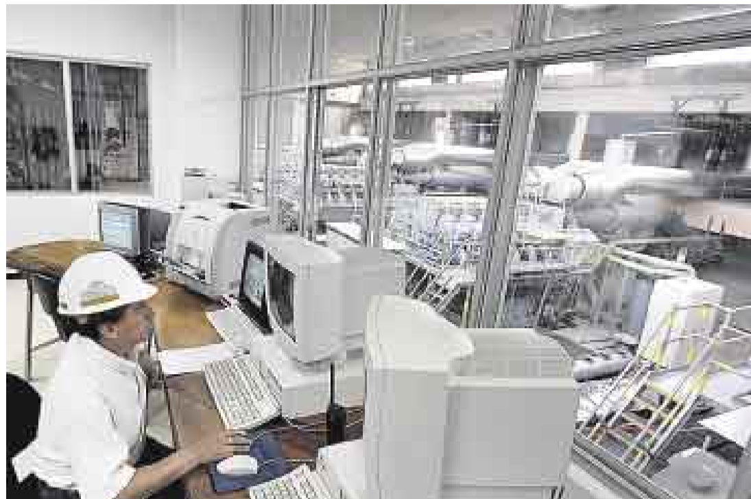
DESORDENADO. Especialistas señalaron que el crecimiento de la generación eléctrica ha sido desordenado.