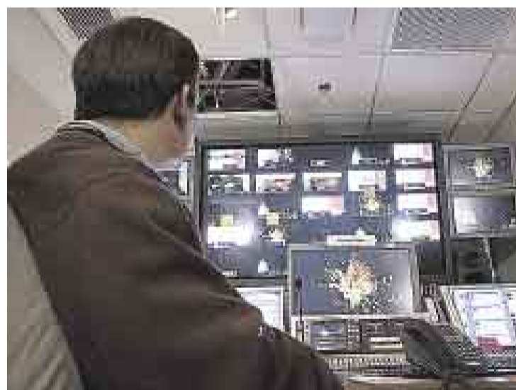
SOBREDOSIS DE TV. Aún restaría saber qué alternativas tienen los usuarios que no desean tener más canales de Cable Mágico.

■ Aumento de tarifas de Cable Mágico está permitido, según estipula contrato con usuarios