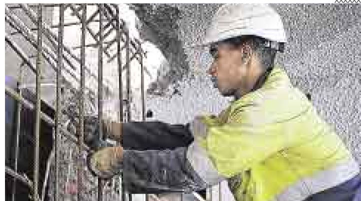
CONSTRUYENDO. En agosto, la construcción volvería a ser protagonista del crecimiento del PBI. Habría crecido 13,2%.