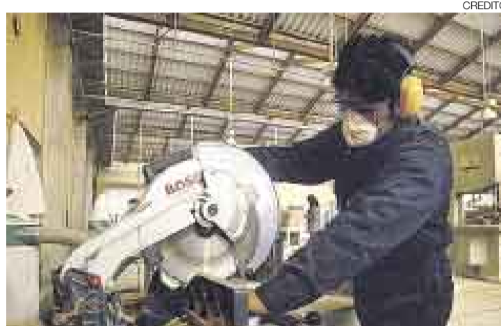
EN LA RECTA FINAL. De acuerdo con lo señalado por el ministro Pasco, la ley mype entrará en vigencia a partir del primero de octubre