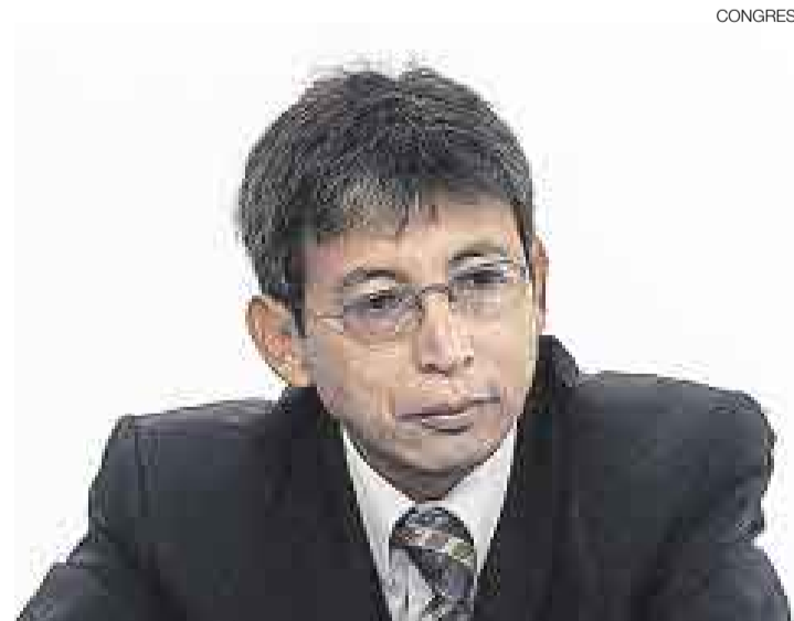
DETALLE. El viceministro de Hacienda, José Arista, contestó a dudas puntuales de los congresistas sobre el presupuesto del 2009.

El Gobierno ha previsto repartir el Foniprel del 2009 con la transferencia de S/.791 millones a los gobiernos regionales y S/.1.240 millones a los gobiernos locales. Más de un congresista expresó su disconformidad con el he-