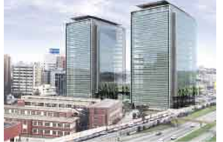
ASÍ SERÁ. Las dos torres de Plaza República ampliarán la oferta del mercado de oficinas A1, en San Isidro.