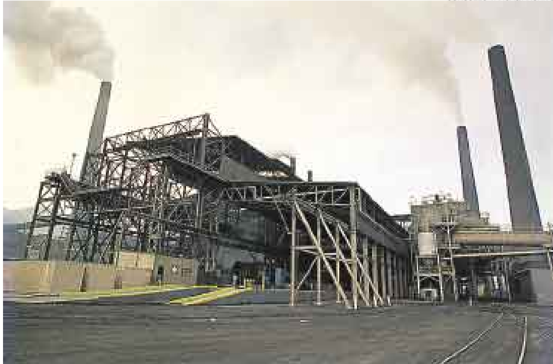
A CANCELAR. Las refinерías señalan que el retraso en los pagos les ha ocasionado altos costos financieros.

■ Monto es el 32% de la deuda que tiene el fondo y que no paga el Gobierno desde el 2007