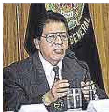
SÁNCHEZ. A la espera del cambio.

Positivas han sido las reacciones a la reforma constitucional que propone modificar el artículo 100 de la Carta Política de 1993, el cual establece que “los términos de la denuncia fiscal y del auto apertorio de instrucción no pueden exceder ni reducir los términos de la acusa-