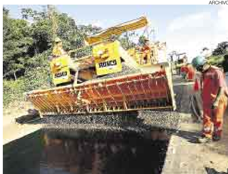
DÉFICIT. El gasto en infraestructura debería superar los US$4.000 millones anuales, según Luis Guasch, funcionario del Banco Mundial.

Guasch explicó que el Perú continúa con carencias en cuanto al servicio de agua y saneamiento, electrificación, telecomunicaciones y vías de co-