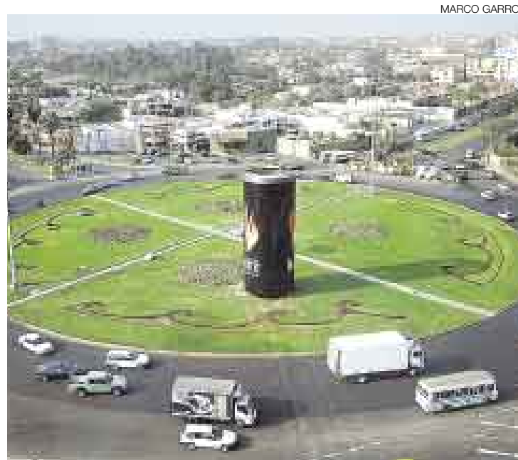
¡QUÉ LATA PARA GRAU! Lector protesta contra una publicidad callejera que le roba cámara nada menos que a Miguel Grau (ver: Óvalo vejado).

En la intersección de las avenidas Javier Prado y Las Palmeras, en el límite de La Molina y Santiago de Surco, se ubica el óvalo Monitor, en cuyos jardines reposa un busto del almirante Miguel Grau. En ese parque se realizan ceremonias en homenaje a nuestro héroe. Sensiblemente, en el sector que corresponde a la Municipalidad de Surco, se ha erigido una enorme estructura metálica con fines publicitarios de una transnacional de bebidas gaseosas. Ese elemento extraño rompe la armonía arquitectónica del parque y, lo que es peor, perturba la soledad del héroe. Resulta necesario que Surco detenga la obra y deje sin efecto la licencia de construcción que pueda haber otorgado. En el supuesto caso de que ello no sea posible por compromisos contractuales asumidos, sugiero que se traslade la efígie de Grau y que el parque dentro del óvalo sea rebautizado con el nombre de la bebida energizante que ocupa los jardines de esa importante plaza pública.