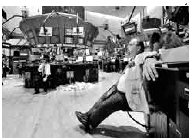
¿HASTA DÓNDE? Un operador de la bolsa de Nueva York observa anodado la caída de la bolsa. Parece preguntarse, ¿cuánto más puede caer?

La reacción de los mercados de acciones de EE.UU. se dejó sentir en toda la región. Mientras que las bolsas neoyorquinas caían 4,5% en promedio, la caída en las bolsas latinas alcanzaba su punto más bajo en la bolsa de Sao Paulo, que en un momento llegó a registrar una caída de 12,3%, lo que obligó al cierre temporal de las operaciones. Detener la negociación es un mecanismo válido, pero muy poco usado para obligar a un mercado volcado hacia un solo lado (compra o venta) a repensar sus estrategias y ‘respirar’ antes de continuar. Para Sao Paulo resultó, pues, tras la suspensión temporal de la sesión,