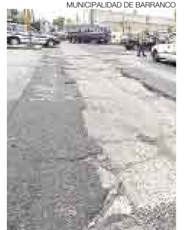
AV. LIMA. Los baches le restan fluidez al tránsito vehicular.

■ Pro Transporte anunció que los trabajos iban a empezar el 20 de setiembre