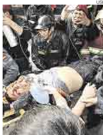
FATAL. Iban a atender una emergencia, uno de los policías murió.