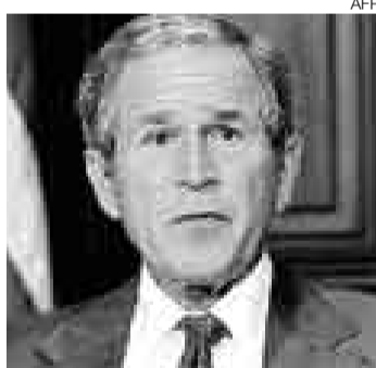
ALIVIADO. George W. Bush.

"Ejercer la autoridad (concedida) en esta ley de una manera responsable requerirá cuidado-