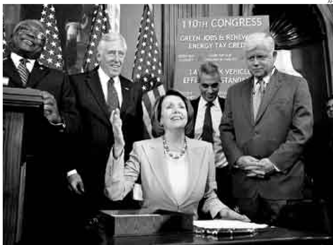
ALIVIO. Luego de haber rechazado el plan de rescate financiero el lunes, esta vez la Cámara de Representantes dijo sí.

"Un problema grande en nuestro sistema financiero fue que los bancos restringieron el flujo de crédito a los negocios y consumidores. Muchos de los bienes que