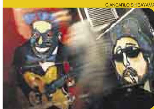
COLOR. Además de un genial ambiente nocturno, Mochileros es una ventana abierta a la cultura.