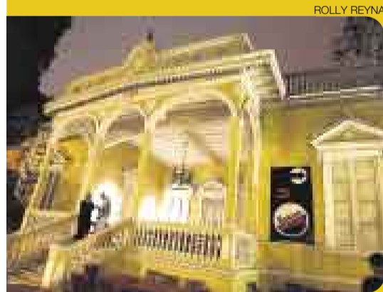
CON HISTORIA. La Casona Solari fue construida en 1903 y fue adquirida por los Solari en la década de 1970.