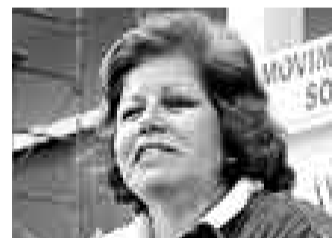
LOURDES FLORES NANO LIDERESA DE UNIDAD NACIONAL

“En lo político nada es más sano, nada es más democrático, y nada preserva más el sistema que el planteamiento de remoción del Gabinete Ministerial. Unidad Nacional insistirá en la censura porque es un gesto democrático”