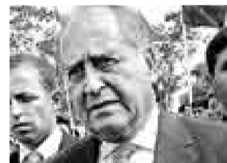
ÁNTERO FLORES-ARAOZ MINISTRO DE DEFENSA

“No debería arrastrar a todo un Gabinete. No se puede aprovechar de una situación singular para una conclusión general, desconociendo todos los avances y los retos que tiene el Perú para los próximos meses, como el APEC o el TLC con Estados Unidos”.