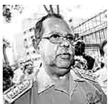
LO BUSCA. Octavio Salazar.

ral de Migraciones y Naturalización informaron que han repartido fotografías del ex ministro en los puestos de control migratorio del aeropuerto y en las zonas de frontera, no obstante, advirtieron