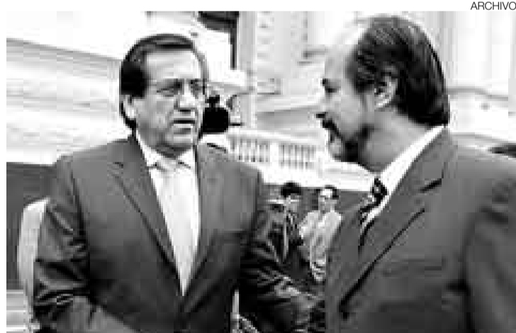
AL FILO DE LA CENSURA. Hasta ahora habría 59 de los 61 votos para respaldar la censura política al Gabinete Ministerial de Del Castillo.

Mañana viernes se reunirán los voceros de las bancadas parlamentarias con la Mesa Directiva