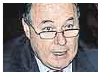
RAÚL CASTRO STAGNARO CONGRESISTA UNIDAD NACIONAL

“Quiero interpretar las cosas en el sentido de que ha habido una falta de coordinación, porque se pensó que al mediodía se presentaría el Gabinete Ministerial en el pleno del Congreso, pero al final el acuerdo mayoritario fue que eso ocurriría el próximo martes 14”.