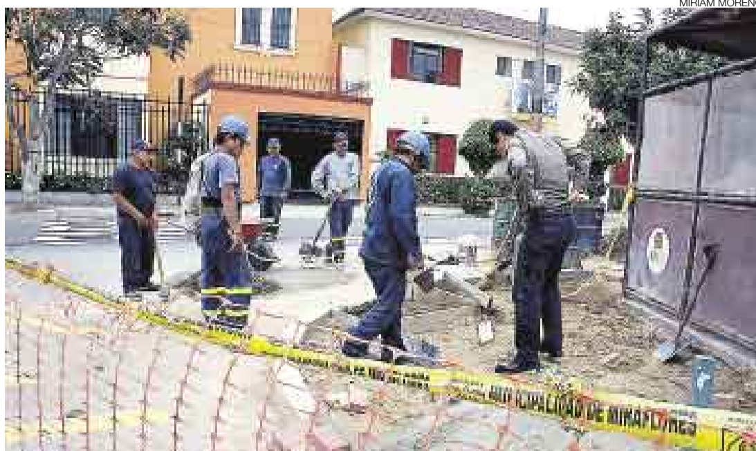
CORRECCIONES. Personal de la Municipalidad de Miraflores aún realiza trabajos en la tercera cuadra de la calle Berlín, donde se corrigen los errores de construcción que presentan las rampas para personas con discapacidad.