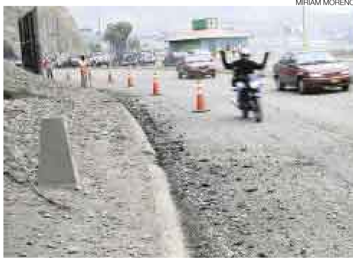
COSTA VERDE. La Municipalidad de Lima ha iniciado la rehabilitación de la pista de la Costa Verde en el tramo que atraviesa Barranco.