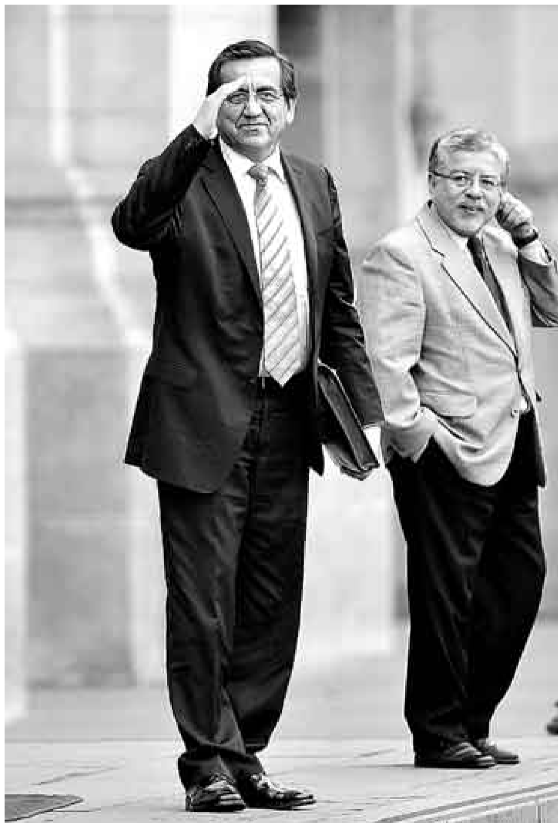
CASICIEN. El presidente García contó ayer que fueron 98 las sesiones de Consejo de Ministros que sostuvo con el gabinete Del Castillo. Un día antes, el jueves, el ex primer ministro se había despedido al salir de Palacio de Gobierno.

Horas antes de que se conociera la noticia, Simon señaló que había sido convocado por el jefe del Estado para analizar la situación política. Al consultársele si le ofreció la Presidencia del Consejo de Ministros, respondió que estaba haciendo “algunas evaluaciones” y que el lunes volvería a Palacio. Por la noche reveló a CPN Radio que García le habría hecho la mis-