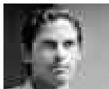
HÉCTOR VILLALOBOS PÁVLICA

A pocas horas de su juramentación, el próximo presidente del Consejo de Ministros explica algunos de sus primeros pasos en el cargo