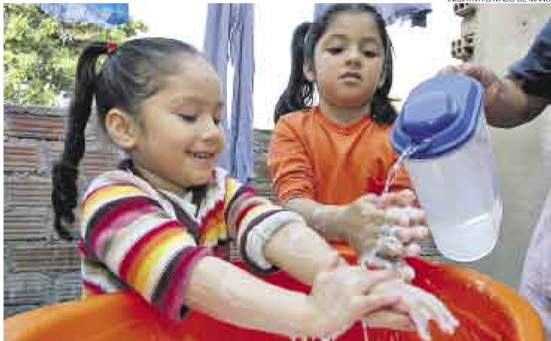
INICIATIVA LAVADO DE MANOS

“El lavado de manos con jabón (de cualquier tipo) es la vacuna más barata para reducir diversos problemas de salud”, señala