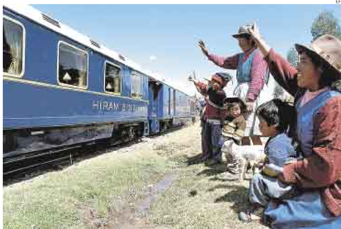
PARA UN BUEN VIAJE. Más de la mitad de las agencias no están reconocidas por la Dircetur. Tome sus precauciones

De acuerdo con Perú Rail, el único operador del servicio ferroviario a Machu Picchu, en octubre y noviembre dicha empresa tiene capacidad para trasladar mensualmente a 12.000 estudiantes en el servicio de tren local. Sin embargo, la demanda supera largamente los 24.000 que puede trasladar en esos dos meses.