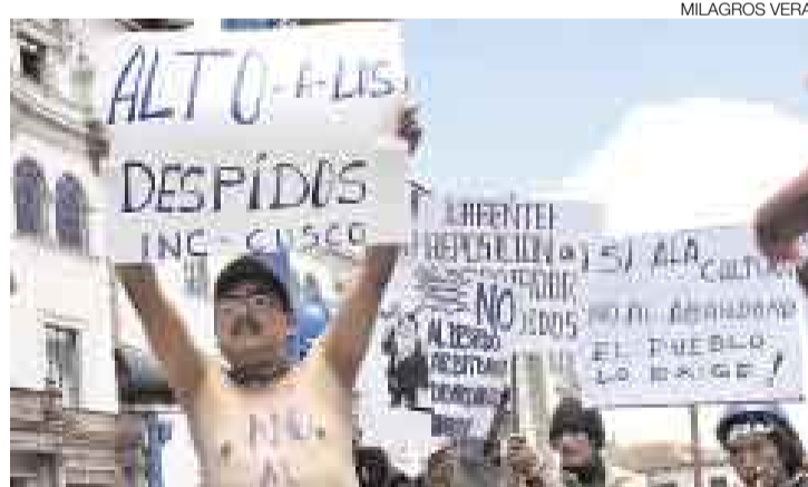
QUEJAS EN LAS CALLES. La Ciudad Imperial se llenó otra vez de manifestantes. Esta vez los trabajadores del INC dieron a conocer sus demandas.

Por esta misma razón, además, 1.500 trabajadores administrativos ya han recibido cartas de despido y unos 1.120 obreros dejarán de laborar a fines de octubre, informó el secretario gene-