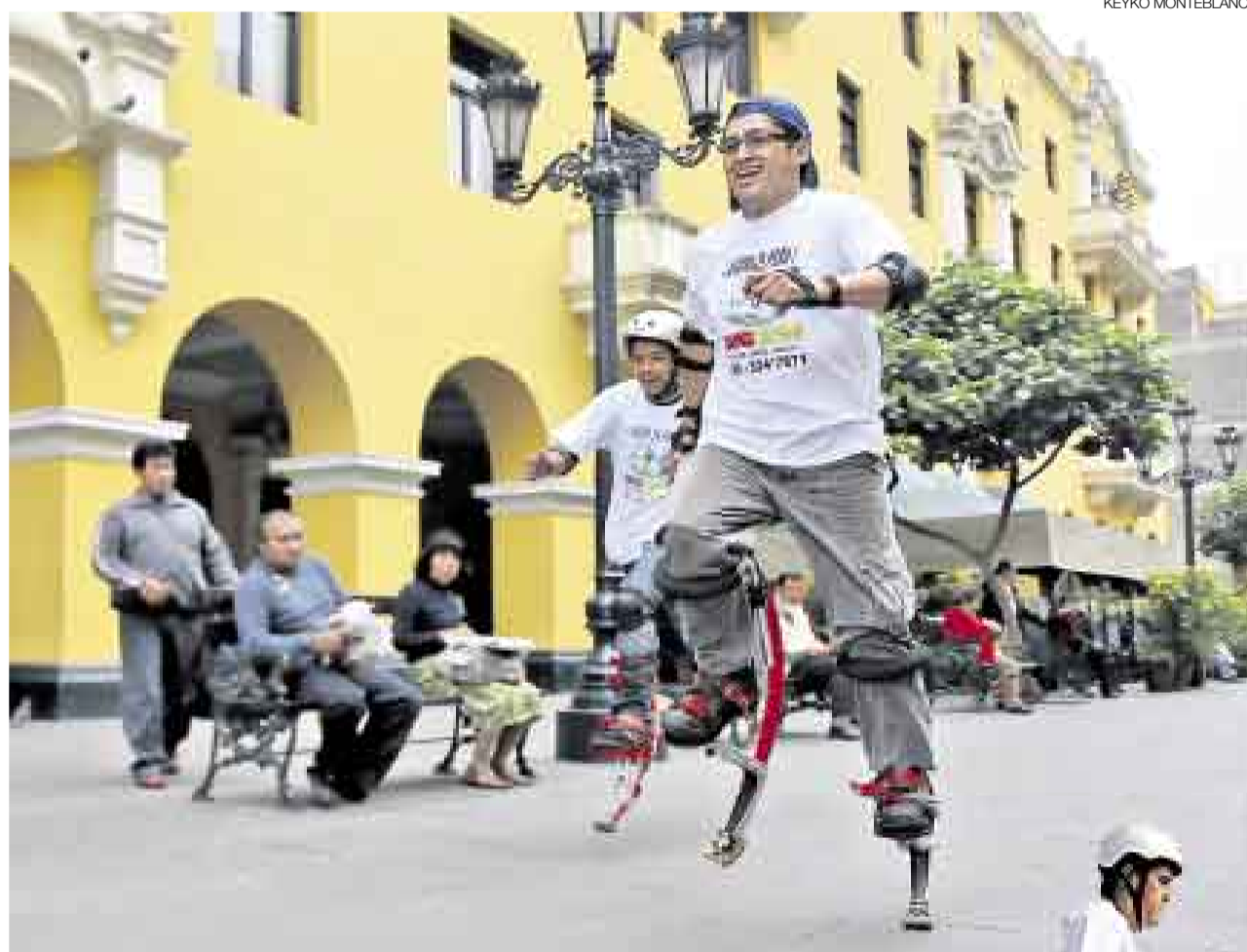
EL QUE NO SALTA... Se pueden armar grupos de hasta seis personas, de todos los pesos, desde 40 hasta 120 kilos.