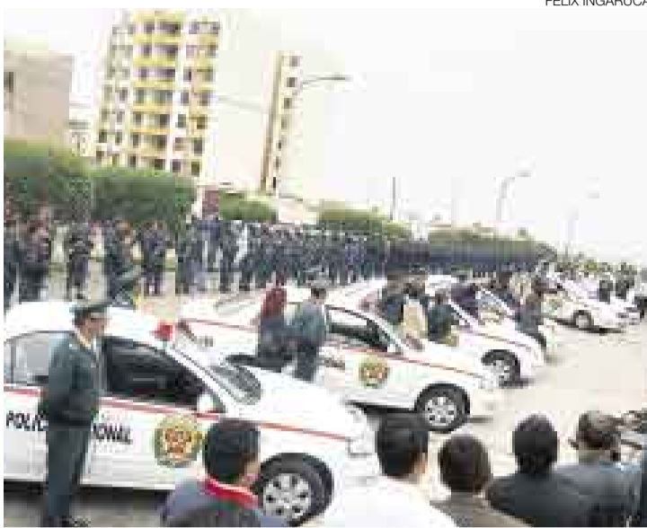
EN LUCHA. El distrito de San Miguel recibió ayer diez unidades policiales para hacer frente a la delincuencia, que afecta a uno de cada tres de sus pobladores.

La creciente ola de robos en bancos de la capital—bajo la modalidad de ‘marcas’—ha puesto nuevamente en la mira el problema de la inseguridad ciudadana. Según cifras de la Policía Nacional, al mes se reportan 12 denuncias de este tipo en Lima y Callao. Por ello, la PNP implementó recientemente el plan Protégeme, destinado a prestar vigilancia a los clientes que retiran fuertes sumas de dinero de estas entida-