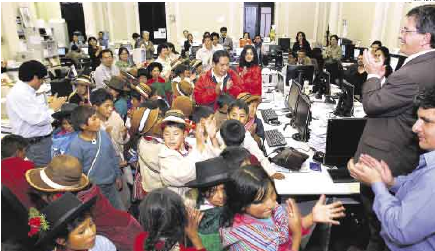
OVACIONADOS. En la sala central de la redacción los periodistas recibimos con aplausos a los pequeños visitantes, que se interesaron mucho por ver cómo trabajamos.