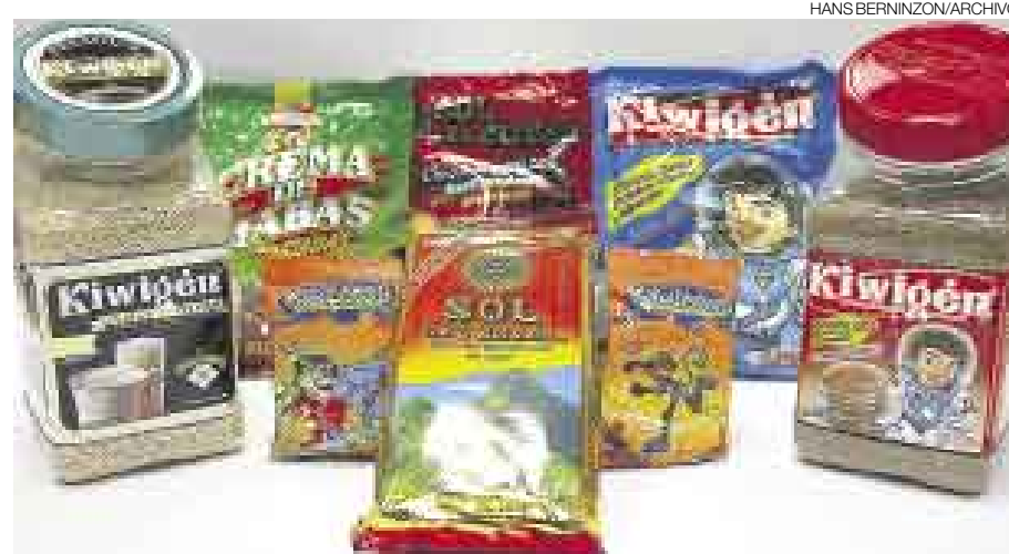
MUDANZA. INCASUR ESTÁ TRASLADANDO SUS INSTALACIONES A ÑAÑA PARA TENER MÁS ESPACIO.

Ejecutivos de Inca Sur viajaron a Estados Unidos y México con el objetivo de afinar los detalles para producir en esos países, a través de terceros, el producto Amaragén , que es el nombre comercial de Kiwigén , elaborado a base de kiwicha. La variación del nombre se debe a que la kiwicha es conocida en México como amaranto. De otro lado, Inca Sur está en