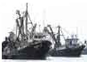
GRAN ARRASTRE. LA NAVE SE CONSTRUIRÁ EN CHILE.

Los accionistas de la pesquera Austral Group están evaluando la posibilidad de comprar una embarcación de gran arrastre para pescar jurel y caballa fuera de las 200 millas. De concretarse el proyecto, Austral Group podrá internarse en otras aguas y capturar el recurso cuando esté ausente en las costas peruanas. La nave, que sería construida en un astillero chileno, tendría una capacidad de almacenamiento de 1.600 TM. Los trabajos de construcción se iniciarían luego de que el Ministerio de la Producción les dé luz verde, algo que estiman sucederá en breve.