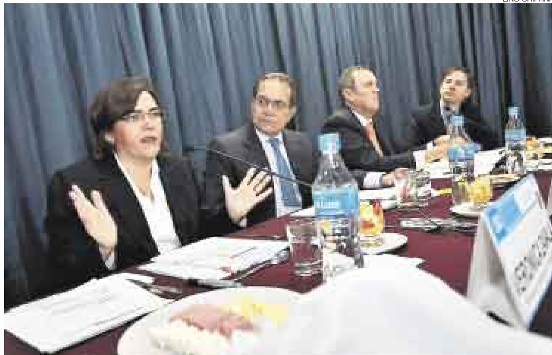
ESFUERZO ESTATAL. La ministra Zavala aseguró que el Gobierno no reducirá la inversión pública en infraestructura.