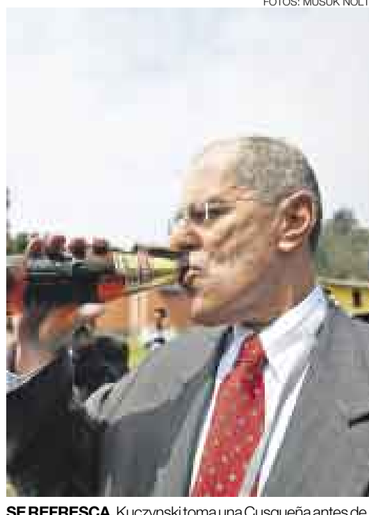
SE REFRESCA. Kuczynski toma una Cusqueña antes de los frejoles con seco del almuerzo inaugural.