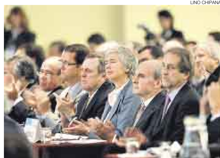
RETOS. Ingresar a nuevos mercados del exterior no debe asustar a los empresarios. Eso sí, hay que ir y fortalecer una marca para ganar espacio.

"Estos proyectos no son de corto plazo, tienden a madurar lentamente porque es difícil aprender la cultura y hay que adaptarse internamente a los cambios en un país. Para esto debe involucrarse a toda la organización en bloque sobre la experiencia de invertir afuera", apuntó Freyre.