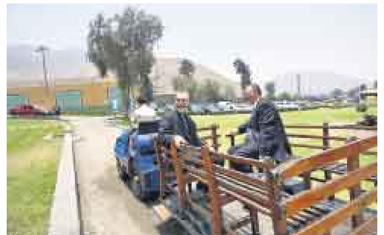
UNA JALADITA. Empresarios llegando a la CADE. Los años no pasan en vano... y la puerta de ingreso estaba muy lejos.