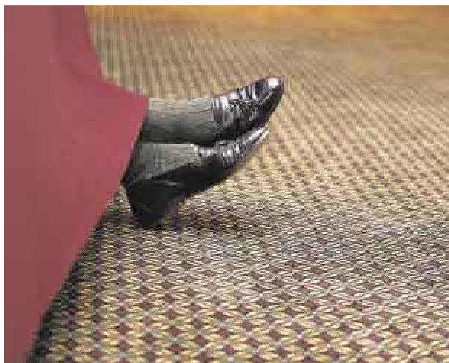
TALLA 45. Los zapatos son un símbolo de estatus. Pero enseñarlos por debajo del mantel...