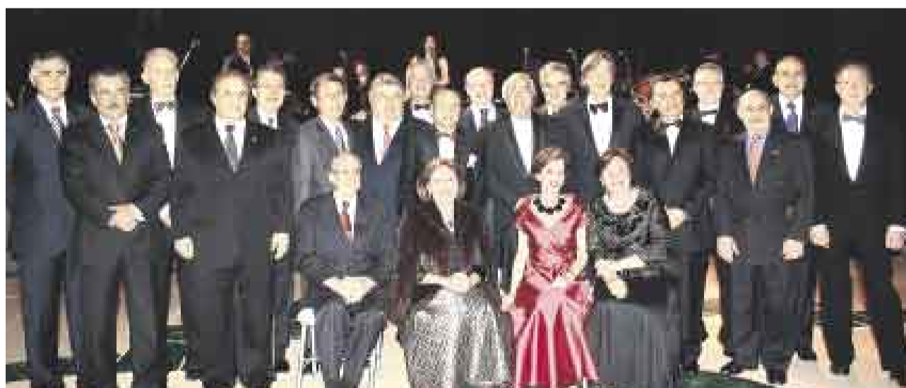
LOS JEFES DE MISIÓN. Sentados: Estados Unidos, Costa Rica, Francia y República Checa. De pie: Egipto, Orden Soberana de Malta, Alemania, Palestina, Honduras, Corea, Brasil, Portugal, Marruecos, Uruguay, Unión Europea, España, Holanda, Colombia, Finlandia, Cuba, México e Italia.