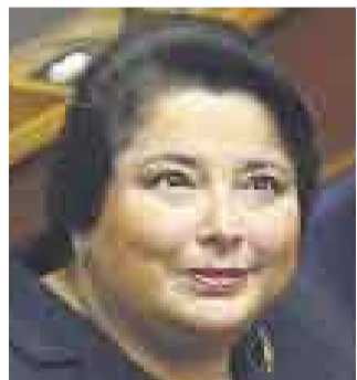
MINISTRA. Beatriz Merino.

El presidente Alejandro Toledo designó como primera ministra a Beatriz Merino. En su presentación informó que el sector Educación era declarado en emergencia. Anunció una estrategia militar coordinada para enfrentar el terrorismo y libertad para opción de métodos anticonceptivos.