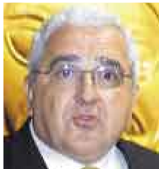
DEBUT. Roberto Dañino.

En su presentación, el primer ministro de entonces, Roberto Dañino, anunció la reducción del Impuesto Extraordinario de Solidaridad del 5% al 2%, y ese monto se traslada al sueldo de los trabajadores. Incremento del Impuesto a la Renta.