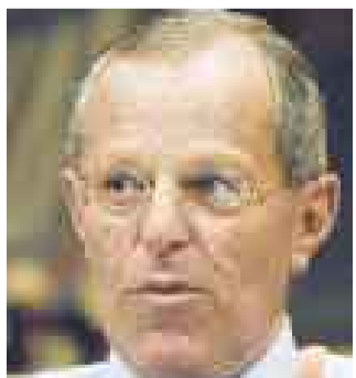
EN EL 2005. P. P. Kuczynski.

Durante la presentación de su Gabinete, Pedro Pablo Kuczynski aclaró que no se reducirían las vacaciones ni se modificaría la CTS. Propone dotar de equipos de cómputo a las comisarías, interconectarlas con el Reniec y modernizar el sistema de radio.