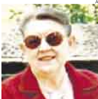
‘TOOT’. Obama hizo una pausa para visitar a su abuela.

decer a todos aquellos que enviaron flores, tarjetas, buenos deseos y oraciones durante este difícil momento”, relataba el comunicado.