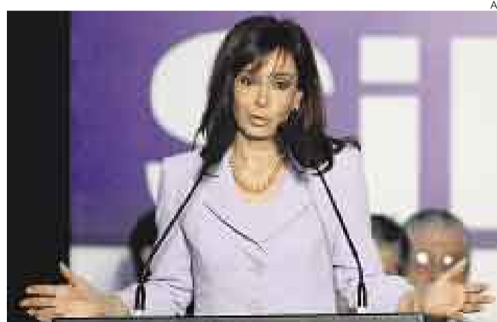
CRITICADA. La decisión tomada por el gobierno de Cristina Fernández es rechazada por los partidos de oposición liberal, derecha y radical.

BUENOS AIRES [AFP]. Los partidos argentinos de oposición liberal, derecha y radical socialdemócrata, junto con patronales de agricultores, protestarán hoy contra la reforma que impulsa el Gobierno para estatizar los fondos de pensión. La movilización se realizará en la víspera del debate en la Cámara de Diputados del proyecto que crea un sistema único previsional.