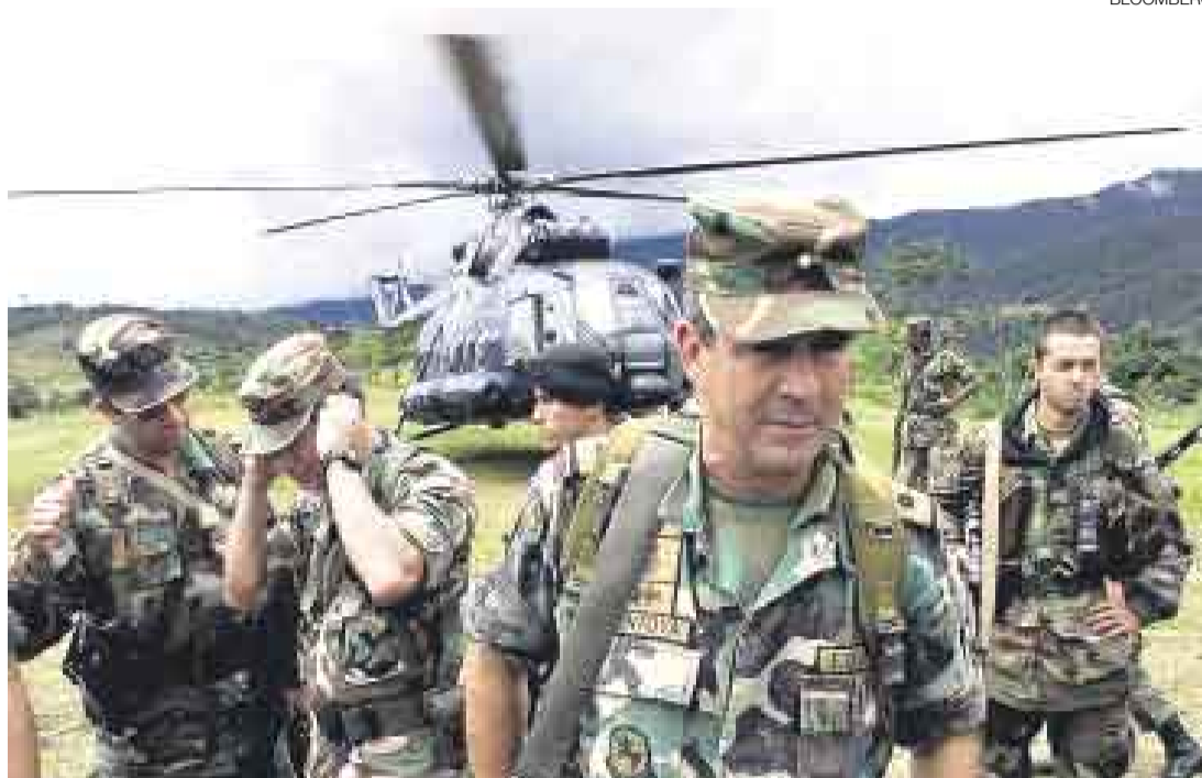
UN ESTRATEGA. El general Mario Montoya fue uno de los principales ejecutores de la operación Jaque.

Montoya no explicó la razón de su renuncia tras 39 años de