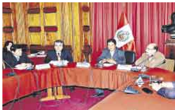
LISTOS PARA TRABAJAR. Sesenta días de plazo tendrá la comisión parlamentaria que analizará el espinoso tema del ‘chuponeo’ telefónico.