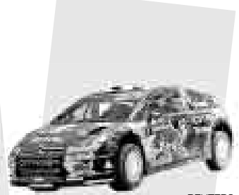
Mundial de Rally Automovilismo

El piloto español de Fórmula 1 Fernando Alonso ha consolidado su contrato con su actual equipo, ING Renault, para la temporada 2009, además de prolongarlo hasta el 2010.