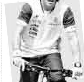
Fernando Alonso Piloto Fórmula 1

El piloto español de Fórmula 1 Fernando Alonso ha consolidado su contrato con su actual equipo, ING Renault, para la temporada 2009, además de prolongarlo hasta el 2010.