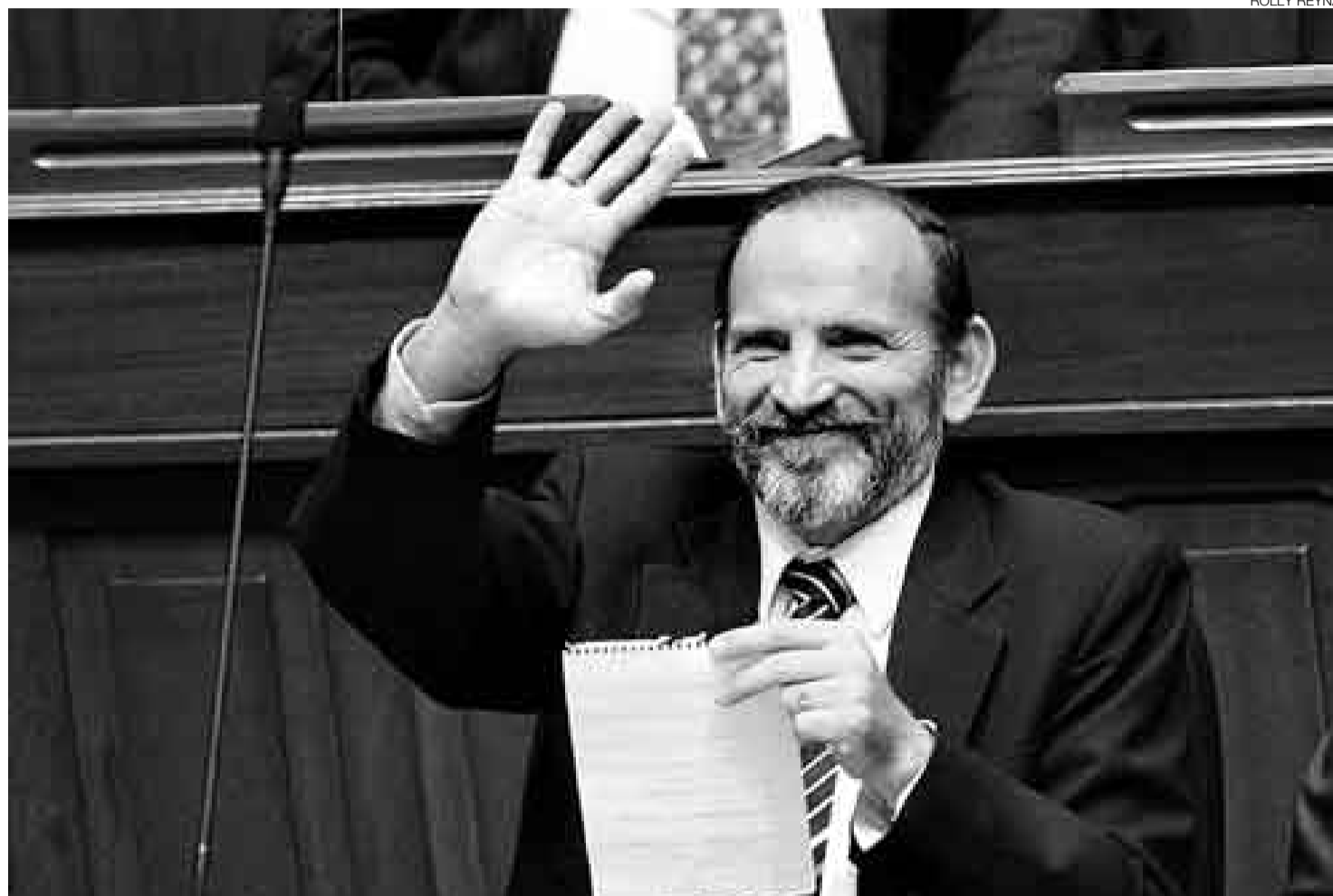
HOMBRE DE CONFIANZA. Yehude Simon se presentó ayer, junto con el Gabinete Ministerial, ante el pleno del Congreso para pedir el voto de confianza.

El tercer aspecto será el desarrollo económico y el combate de la pobreza. El jefe del Gabinete destacó que el Gobierno no recortará el presupuesto en inversión pública, especialmente, en las regiones.