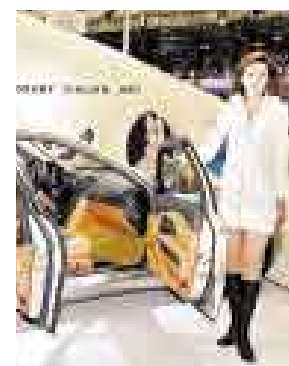
COCTEL. LLUVIA PRIMAVERAL FRUSTRÓ LA INAUGURACIÓN.