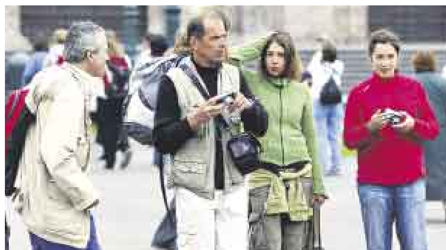
¿SUBIRÁN TARIFAS? LA PROPUESTA ORIGINAL DEL OSITRÁN ERA QUE BAJEN, PERO SUBIRÍAN.

Tras la audiencia pública en la que el Ositrán defendió su propuesta de ajuste de tarifas para cinco servicios de LAP , quedó claro que tendrá que hacer ajustes, pues al menos la valorización del edificio principal del aeropuerto Jorge Chávez deberá reducirla. En ese sentido, en la segunda semana de diciembre, cuando anuncie su decisión final, en lugar de un