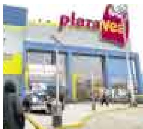
TRES EN RAYA. VEA TENDRÁ TRES LOCALES EN LOS OLIVOS.

Supermercados Peruanos quiere asegurar el atractivo mercado de Lima norte a como dé lugar, y para ello ya empezó las obras de construcción de su próximo supermercado Plaza Vea . ¿Dónde? Pues en la cuadra 13 de la avenida Universitaria, en Los Olivos , donde hasta hace poco funcionaba el camal de Garagay . Con ello, la empresa del grupo Interbank tendría tres tiendas en esa zona: el ex Metro de Carlos Izaguirre y Panamericana Norte, su tienda de la avenida Las Palmeras , y la comentada líneas arriba. Para que nada se le escape.