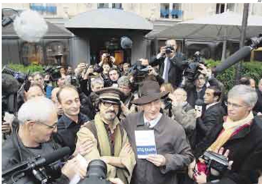
CELEBRA. El escritor Atiq Rahimi (con gorra) sale del restaurante Drouants en París rodeado por sus 'fans'.

"Estoy siempre en busca de algo misterioso que ocurre entre esos dos idiomas magníficos que son el farsi y el francés", declaró el