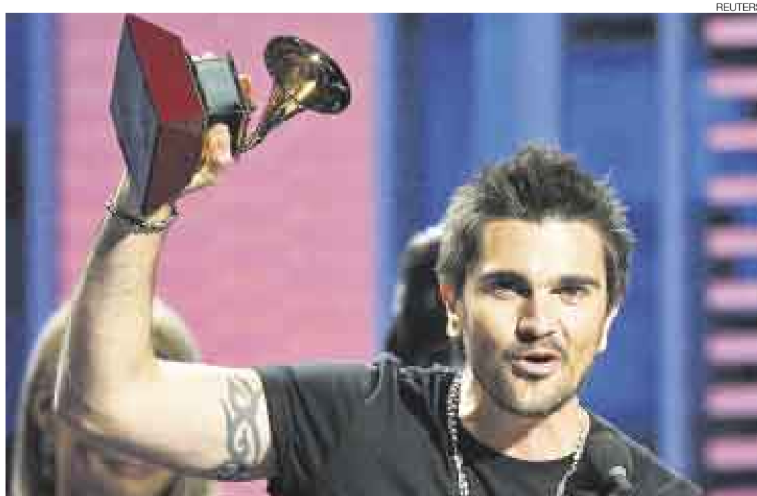
ARRASÓ. El cantante colombiano ya superó al español Alejandro Sanz en la suma histórica de gramófonos dorados.

■ Juanes consiguió ayer cinco premios Grammy Latino, incluidos los de álbum del año y canción del año, con lo que llegó a 17 gramófonos dorados en su carrera, la mayor cantidad cosechada por un artista latino desde que se entregan estas distinciones. Los peruanos nominados no tuvieron suerte.