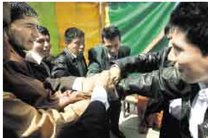
FUERZA. Minutos antes de salir al escenario, un grito para la suerte. Tras caer por robo agravado o secuestro, los internos buscan su rehabilitación.

L ibertad de movimiento es organizar a diez muchachas que bailan para olvidar el encierro, los errores del pasado y alguna inevitable decepción en el camino. Libertad de movimiento es cargarse a la espalda risitas cáusticas de otros reos varones, solo por las ganas de hacer de una danza un ritual de la dignidad. Libertad de movimiento es ensayar y tropezarte y volver a practicar cada paso con tus compañeros, porque siempre es posible arrancarle risotadas a la adversidad de estar preso, y aspirar a un momento de triunfo, cualquiera haya sido tu historia. En cuatro penales de Lima palpita esa certeza. El primer concurso de coreografías LiberArte 2008 es una manifestación del derecho inalienable a soñar con todo el cuerpo.