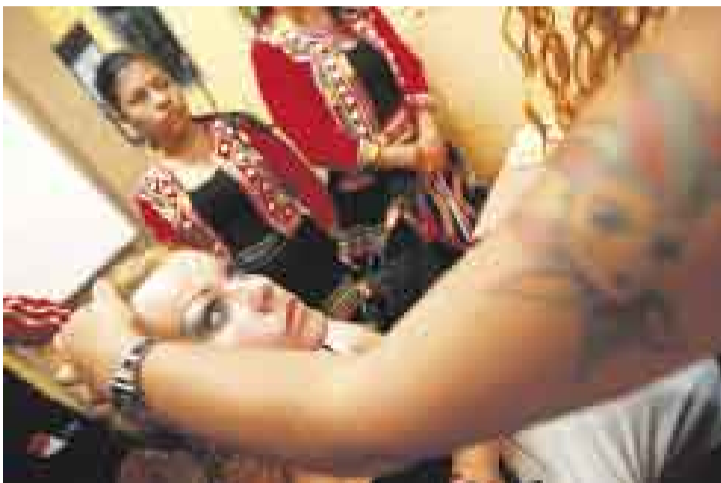
DETALLES. Cada presentación es preparada con esmero. Los penales de San Jorge, Lurigancho y el Callao también mostrarán coreografías.

Tras el éxito de los programas de baile de la televisión, un concurso similar alegra la vida en las cárceles de Lima. LiberArte 2008 es una competencia de coreografías que hace olvidar duros momentos a los internos