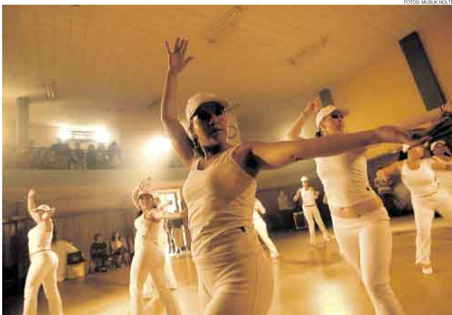
ENTREGA. Las coreografías son fruto de dos meses de ensayos diarios. Las internas de Santa Mónica incluso confeccionaron parte de su vestuario.

El elenco definitivo mantuvo el ritmo hasta esta tarde. Ensayaban todos los días, de cinco a siete de la noche. Un coreógrafo guio sus primeros movimientos erráticos, pulió torpezas y afinó los desplazamientos para los dos primeros bailes. Ellas crearon su propio número de cierre. Ahora, minutos antes de mostrarse ante un jurado de artistas profesionales y famosos, pareciera que todo lo sudado adquiere sentido: incluso en la prisión el cuerpo no tiene límites.