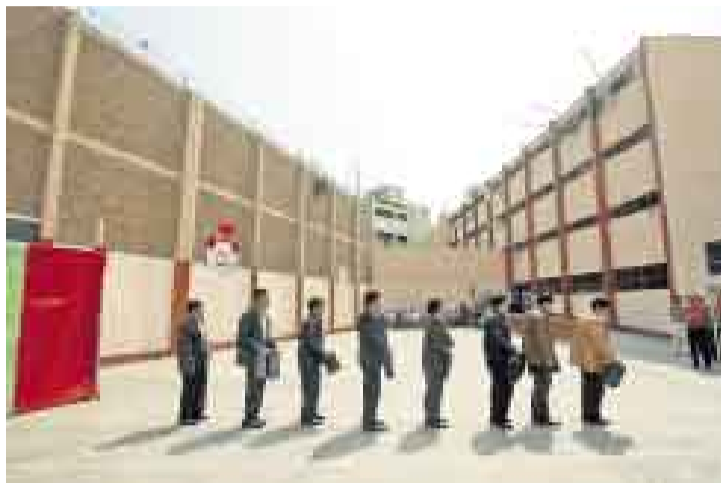
TRIBUNA. La actuación en el patio del pabellón 6A de Castro Castro fue seguida con entusiasmo y aplausos desde las butacas y celdas.