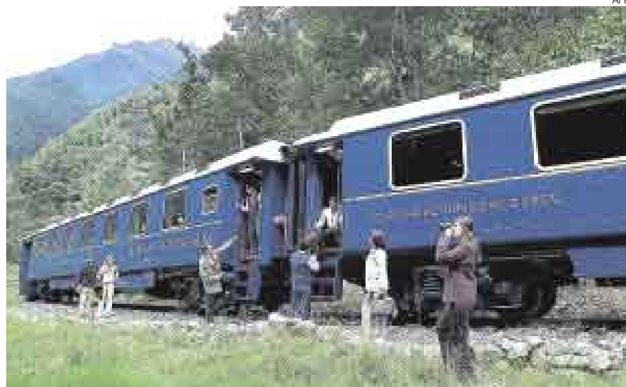
NUEVA SALIDA. SE USARÁ BASES DE LA SUBASTA DE FRECUENCIAS PARA DAR ACCESO.

Tanto en Andean Railways como en Inka Rail están desanimados con la decisión del Ositrán de obligarlas a competir con Perú Rail en una subasta por las frecuencias que pedían en la ruta ferroviaria Cusco-Machu Picchu. Y es que creen que no le podrán ganar a la hora de presentar una oferta económica por la ruta, por estar