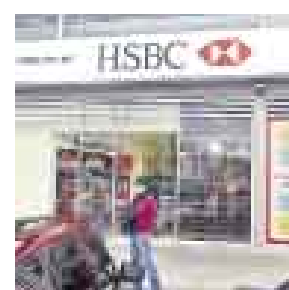
LISTO. ESTE ES EL LOCAL DONDE SE INSTALARÁ.

Ni una severa crisis internacional, ni el costo que representa armar una red de oficinas desde cero, desaniman al HSBC , que sigue expandiendo su red. En los próximos días estará inaugurando su oficina en el jirón Carabaya a la espalda de la Bolsa de Valores de Lima , donde antes había un concesionario de Pandero . El pasaje Acuña , alguna vez hogar de muchas casas de bolsa que migraron (o desaparecieron), se está repoblando. Sevientrega , centro de soluciones en logística ya está ahí.