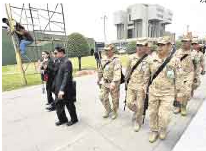
CUENTA REGRESIVA. Mientras se alistan los detalles en el Cuartel General del Ejército para la cumbre del APEC, la seguridad se acrecienta.

[A9] Siga las reuniones y las llegadas de los líderes en: www.elcomercio.com.pe.