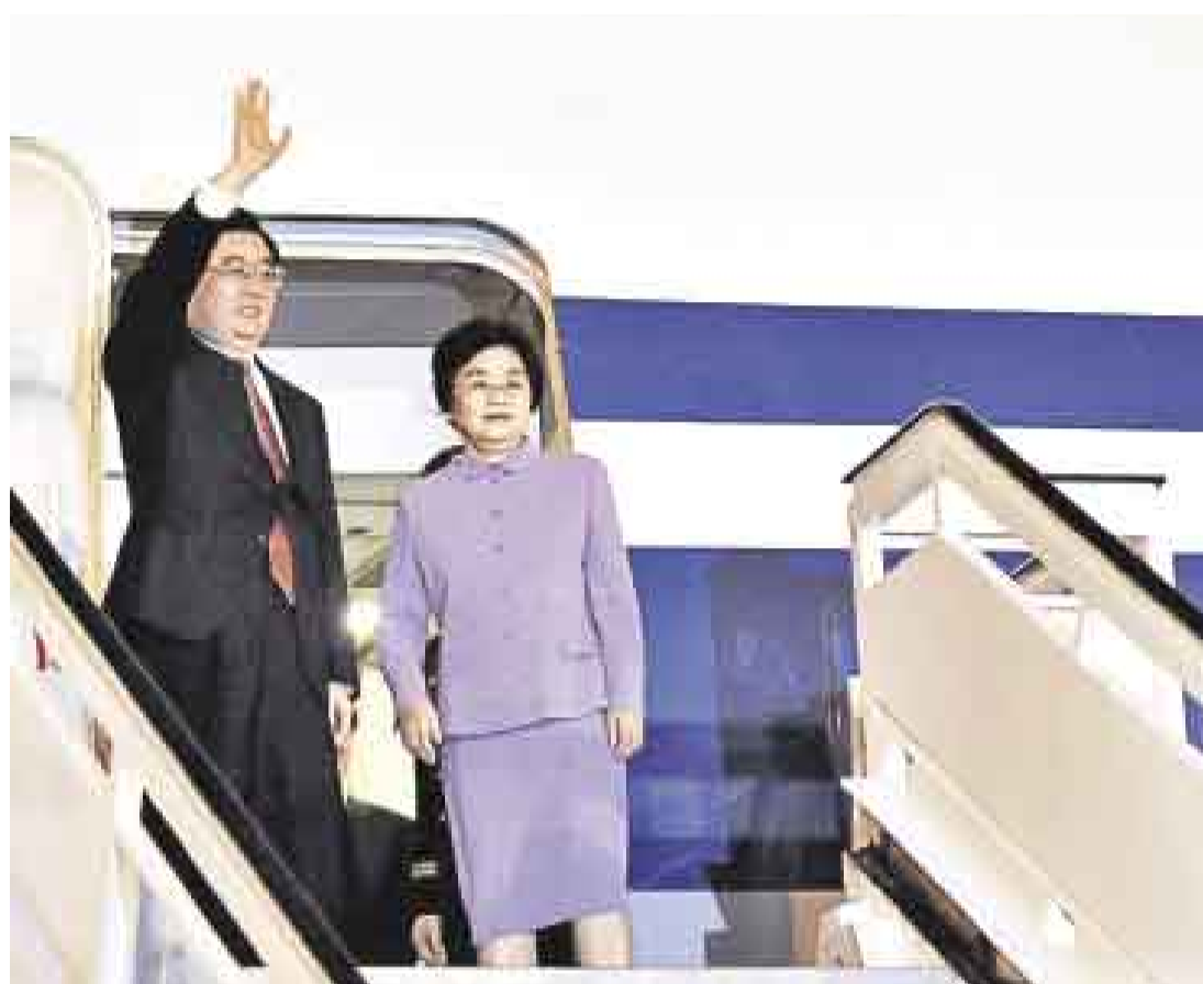
SALUDO. Hoy arriba a Lima el presidente Hu Jintao, junto con su esposa Liu Yongqing. Ayer estuvo en Cuba.

Previamente, se realizó un estudio de factibilidad entre ambas economías, que dio luz verde a