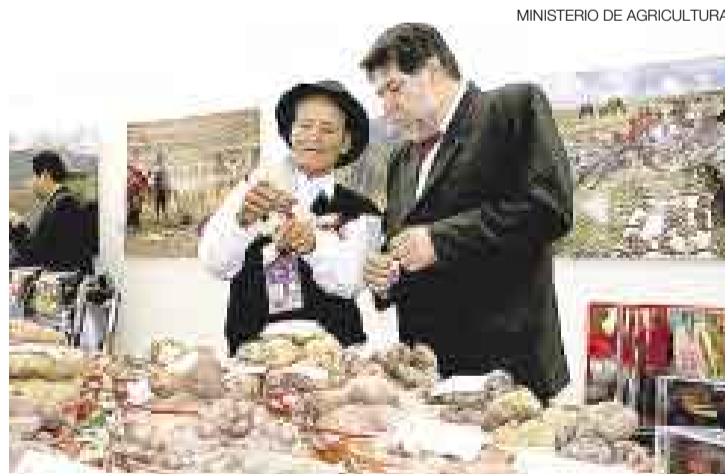
PARA TODO EL MUNDO. El ministro de Agricultura Carlos Leyton presentó la papa peruana a la prensa que cubre el APEC.

En esta exposición, Leyton puso énfasis en el potencial comercial de las papas peruanas y en especial en las variedades nativas.