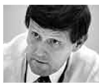
RICHARD E. WAUGH CEO SCOTIABANK

“El del Presidente Bush es un mensaje de fin de gobierno, donde habló de liberalizar mercados y mejorar los controles, y todo muy bonito (...) simpatizo con todo lo que escuché, pero vamos a ver qué se hace efectivamente de ahora en adelante para afrontar la crisis. Los discursos en este tipo de foros son un poco líricos y no se dan respuestas concretas, como si el gobierno va a ayudar o no a los fabricantes de autos”.