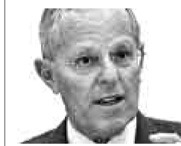
PEDRO PABLO KUCZYNSKI EX MINISTRO DE ECONOMÍA

“El del Presidente Bush es un mensaje de fin de gobierno, donde habló de liberalizar mercados y mejorar los controles, y todo muy bonito (...) simpatizo con todo lo que escuché, pero vamos a ver qué se hace efectivamente de ahora en adelante para afrontar la crisis. Los discursos en este tipo de foros son un poco líricos y no se dan respuestas concretas, como si el gobierno va a ayudar o no a los fabricantes de autos”.