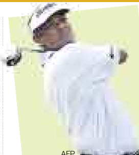
Vijay Singh Golfista

Pese a ser quinto en el ranking mundial de golf, el fiyiano ya es líder en ganancias en el circuito de la PGA con 6'601.094 dólares, y todo gracias a la lesión de Tiger Woods.