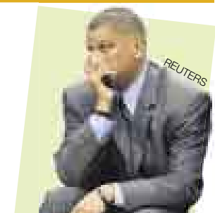
Eddie Jordan Técnico de básquet

Pese a ser quinto en el ranking mundial de golf, el fiyiano ya es líder en ganancias en el circuito de la PGA con 6'601.094 dólares, y todo gracias a la lesión de Tiger Woods.