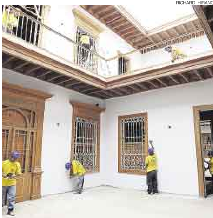
CASILISTA. El valor histórico de la emblemática Casa de las Trece Puertas es incalculable. Su construcción original data del siglo XVI.

Los trabajos de restauración, a cargo de la Municipalidad de Lima, forman parte del Primer