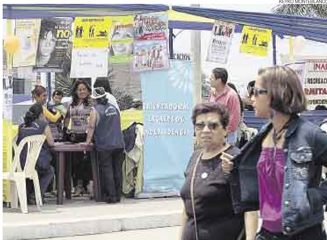
FERIA. Ayer se realizó una feria de asesoría legal y hubo charlas para mujeres en el distrito de Independencia.

El Perú fue uno de los primeros países de América Latina que aprobó leyes especiales sobre violencia familiar (Ley 26260 de 1993 y sus modificaciones), pero sus propósitos no se llegan a cumplir en forma efectiva. Desde el momento en que una mujer acude a una comisaría para sentar una denuncia, tiene