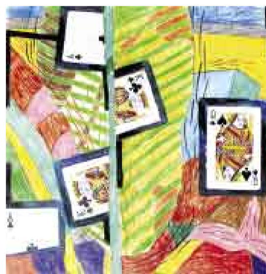
OBRA. Técnica mixta sobre papel, 29,5 x 29,5 cm.

DÓNDE: La Galería (Conde de la Monclova 255, San Isidro) TELÉFONO: 422-1099