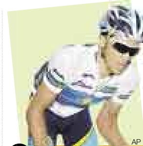
Alberto Contador Ciclista

El corredor español Alberto Contador recibió por segundo año consecutivo la llamada Bicicleta Dorada, premio que otorga al mejor ciclista del año la publicación francesa "Velo Magazine".