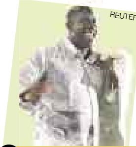
'Magic' Johnson exbasquetbolista NBA

El corredor español Alberto Contador recibió por segundo año consecutivo la llamada Bicicleta Dorada, premio que otorga al mejor ciclista del año la publicación francesa "Velo Magazine".