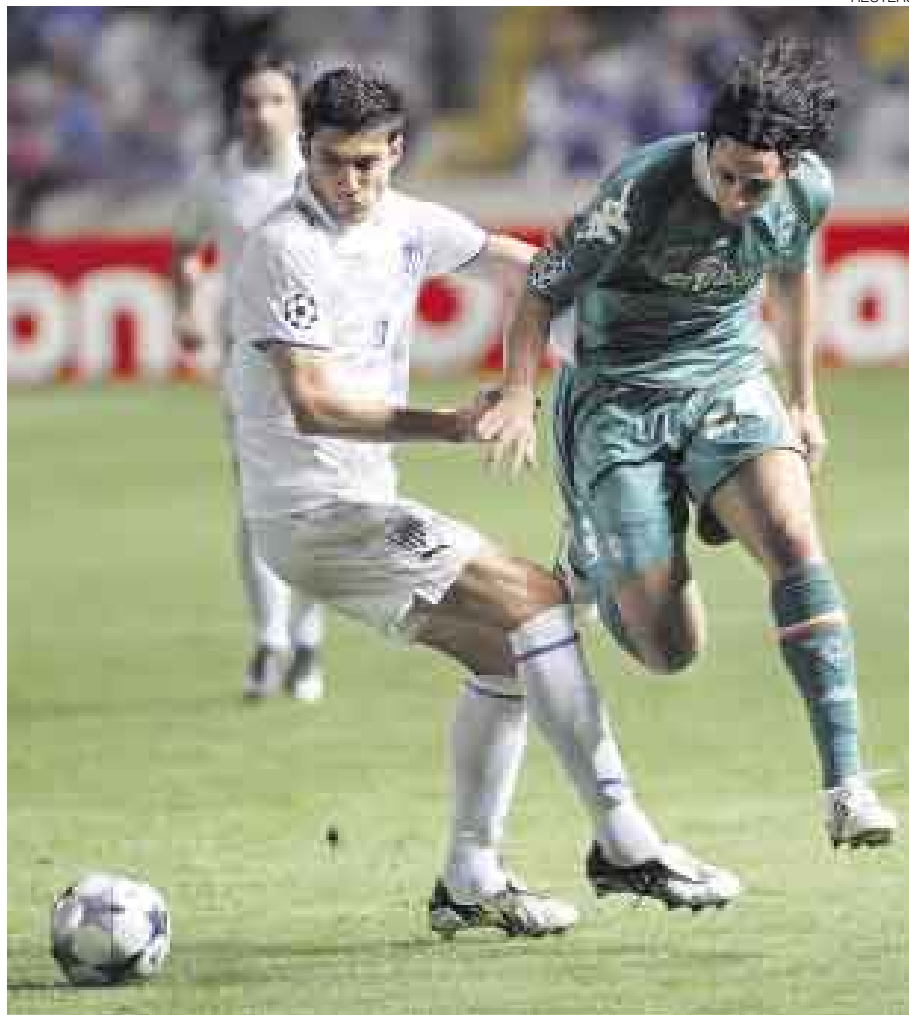
LA VE PASAR. La experiencia de Pizarro en la Champions fue efímera esta temporada.