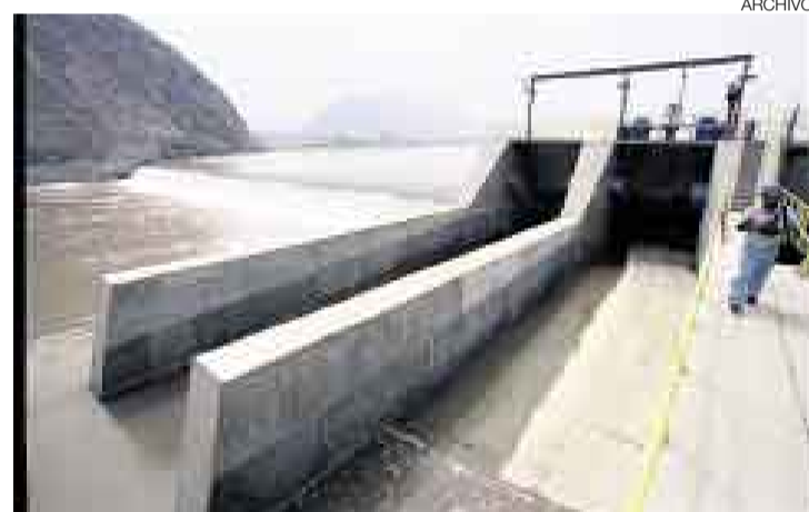
PLANTA MAYOR. La Atarjea lleva casi 52 años en funcionamiento. Sedapal prevé rehabilitarla cuando entre en servicio la planta Huachipa.

lidera la empresa Construcoes e Comercio Camargo Correa de Brasil, será el encargado de llevar a cabo el proyecto que aportará 5 metros cúbicos por segundo (m 3 /seg.) adicionales de agua potable para la capital.