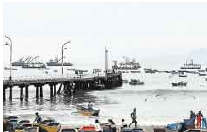
IMPACTOS. La bahía de Chancay es afectada por descargas de residuos urbanos y de las plantas procesadoras. El muelle está descuidado.

transporte público del distrito. El alcalde Guillermo Pozo confirma este proyecto y otro que también impactaría a esta playa: "Se estudia construir en Las Conchitas un nuevo terminal pesquero para trasladar a los pescadores del muelle central".