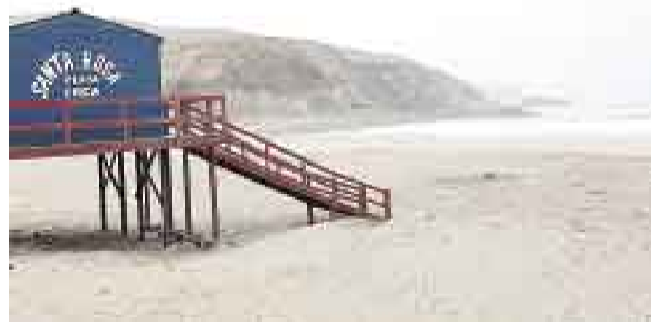
SANTA ROSA. La Municipalidad de Santa Rosa planea concesionar el malecón para implementar los servicios de sus playas Chica y Grande.

La Municipalidad de Chancay no respondió las consultas de este Diario sobre sus playas.