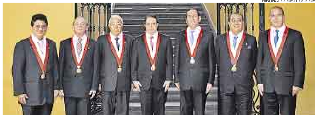
AL VOTO. Esta mañana se producirá la elección del nuevo titular del Tribunal Constitucional.