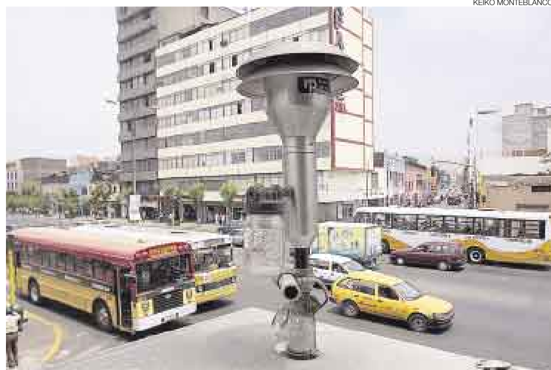
ESTACIÓN CONACO. Todavía la mayoría de equipos que mide la calidad del aire es manual en Lima y Callao.

■ Dos nuevas estaciones estarán en el Callao y una móvil en Lima