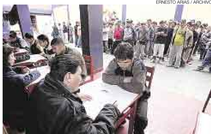
CUSTODIOS. El INPE tiene 5.100 agentes penitenciarios, aproximadamente la mitad de lo que necesita, según cálculos de la propia entidad.

Según adelantó el director de la Escuela de Capacitación del INPE, Andrés Aparcana, posiblemente se suscribirá un nuevo convenio para postergar por tres años más ese proceso de transferencia. Explicó que para relevar a