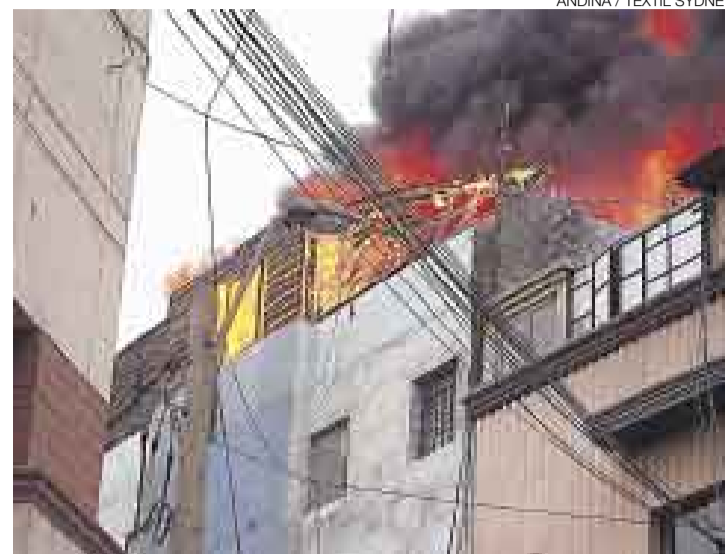
SOLO DAÑOS MATERIALES. El fuego, que se había iniciado por un corto circuito, no dejó víctimas, salvo una persona con señales de asfixia leve.