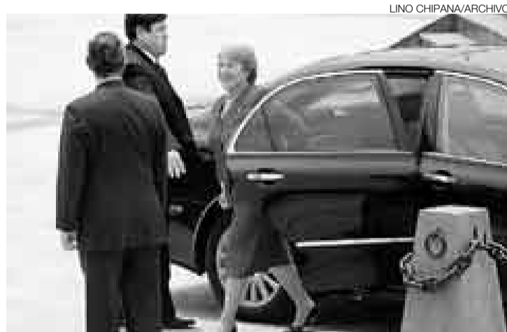
AGUARDA. La presidenta de Chile, Michelle Bachelet, decidió aguardar unos días para saber qué pasos seguir.