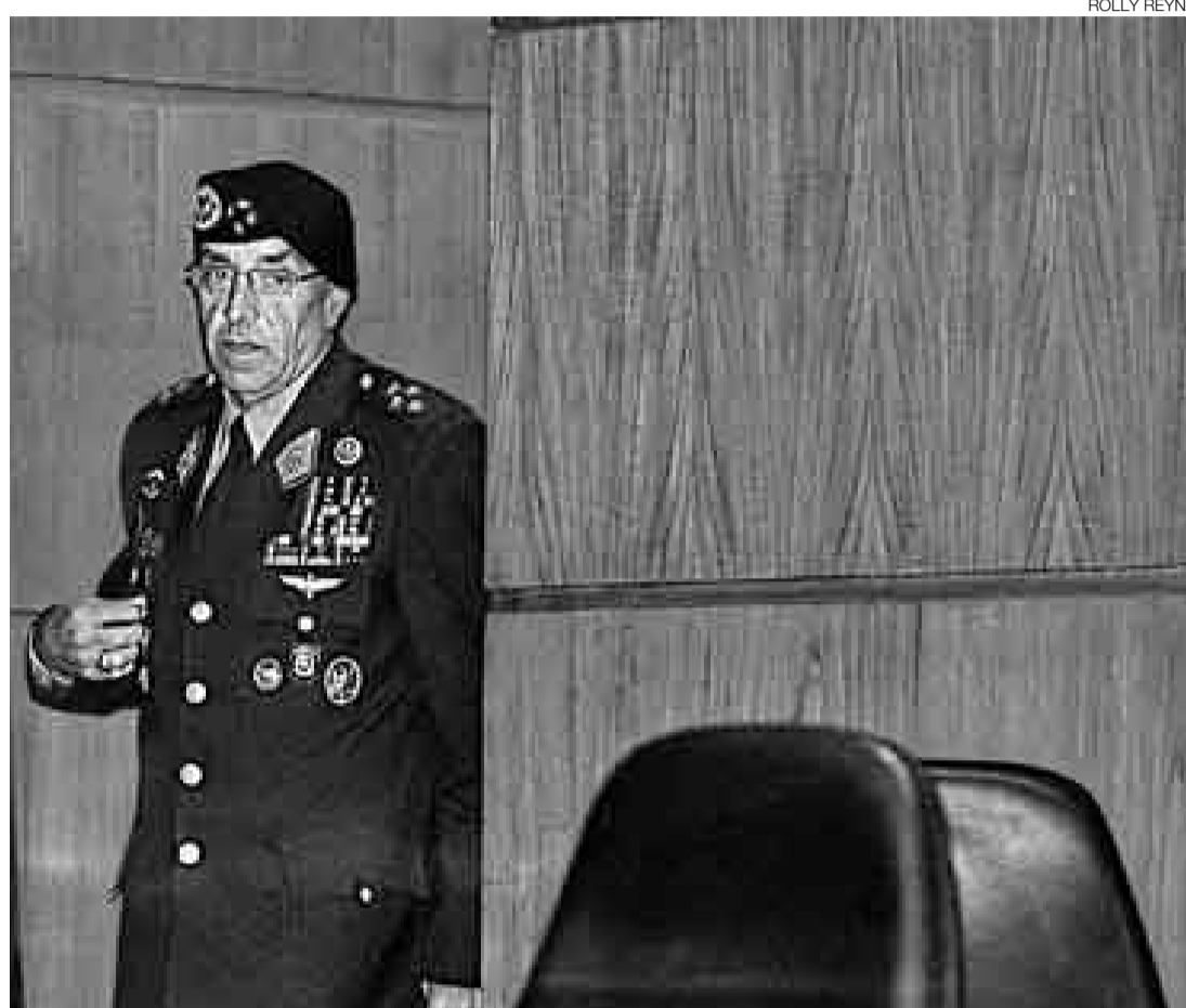
LE OFRECEN LA RECETA. El presidente Alan García y el jefe del Gabinete, Yehude Simon, le recomendaron al general Edwin Donayre hacer una cura de silencio durante los siguientes días.

Mientras tanto, el presidente del Consejo de Ministros, Yehude Simon, quien el domingo ya había calificado de lamentables las palabras de Donayre, ayer volvió a deplorar las declaraciones del oficial militar y lo invocó a guardar silencio. A la vez, Simon expresó su confianza de que el jefe