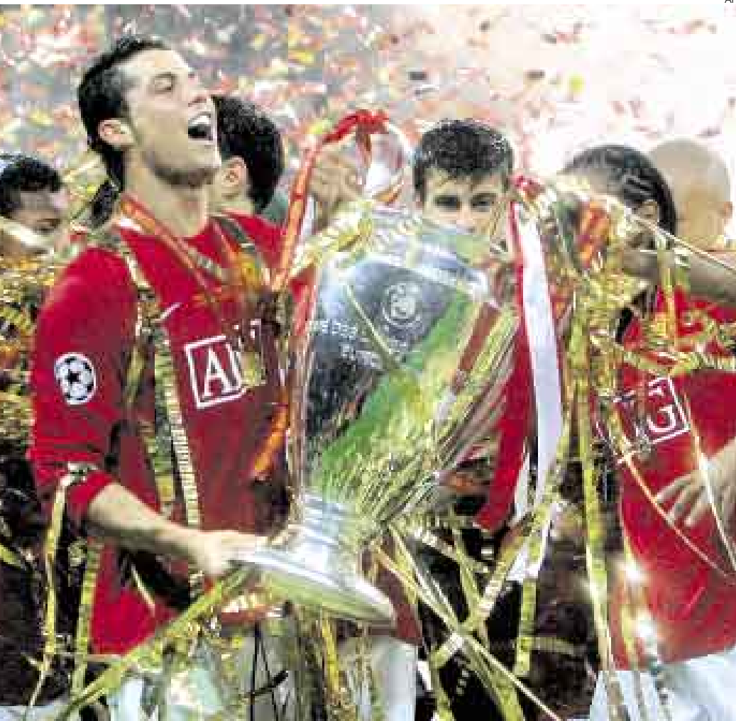
En la Liga Premier, Ronaldo por fin pudo lograr el trofeo que el año pasado obtuvo Kaká.