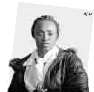
Eunice Barber Atleta

El estadounidense fue elegido mejor deportista del año por la revista "Sports Illustrated", gracias a las ocho medallas de oro que conquistó en los Juegos Olímpicos Beijing 2008.