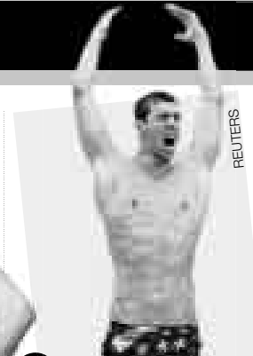
Michael Phelps Nadador

El estadounidense fue elegido mejor deportista del año por la revista "Sports Illustrated", gracias a las ocho medallas de oro que conquistó en los Juegos Olímpicos Beijing 2008.