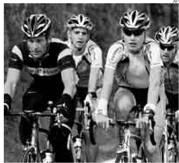
FIRME. Pese a las idas y vueltas, Armstrong correrá el tour.

“Su vasta experiencia nos ayudará”, dijo Contador, que pese a sus amables palabras reiteró que su objetivo para el 2009 es ganar el tour, lo que augu-